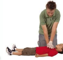
Σε παιδιά >12 ετών

Σε παιδιά <12 ετών ασκούμε πίεση με την παλάμη του ενός χεριού μας.